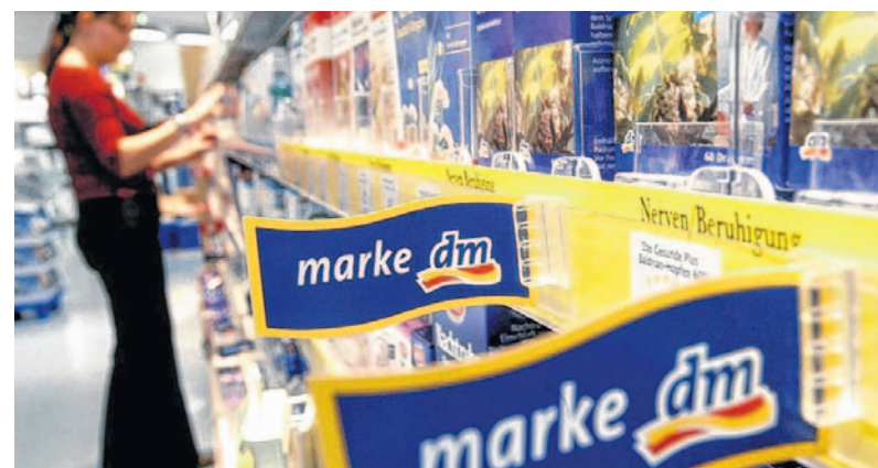
Die Marke dm ist für Schlecker ein harter Brocken.