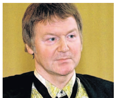
Anton Schlecker auf einem der wenigen offiziellen Fotos.

Jahrelang galt Schlecker als absolutes Feindbild jedes Arbeitnehmervertreters. Haarsträubende Arbeitsbedingungen in den Filialen, Betriebsrats-Schikane, Lohndumping – es gibt fast keine Arbeitgeberstünde, mit der Schlecker nicht irgendwann in den Schlagzeilen stand.