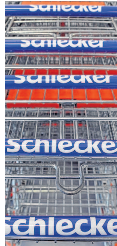
Die Schlecker-Zukunft ist offen.

Schlecker: Meldungen über bevorstehende Planinsolvenz treffen viele Beschäftigte in der Region unvorbereitet / Gewerkschafter sauer