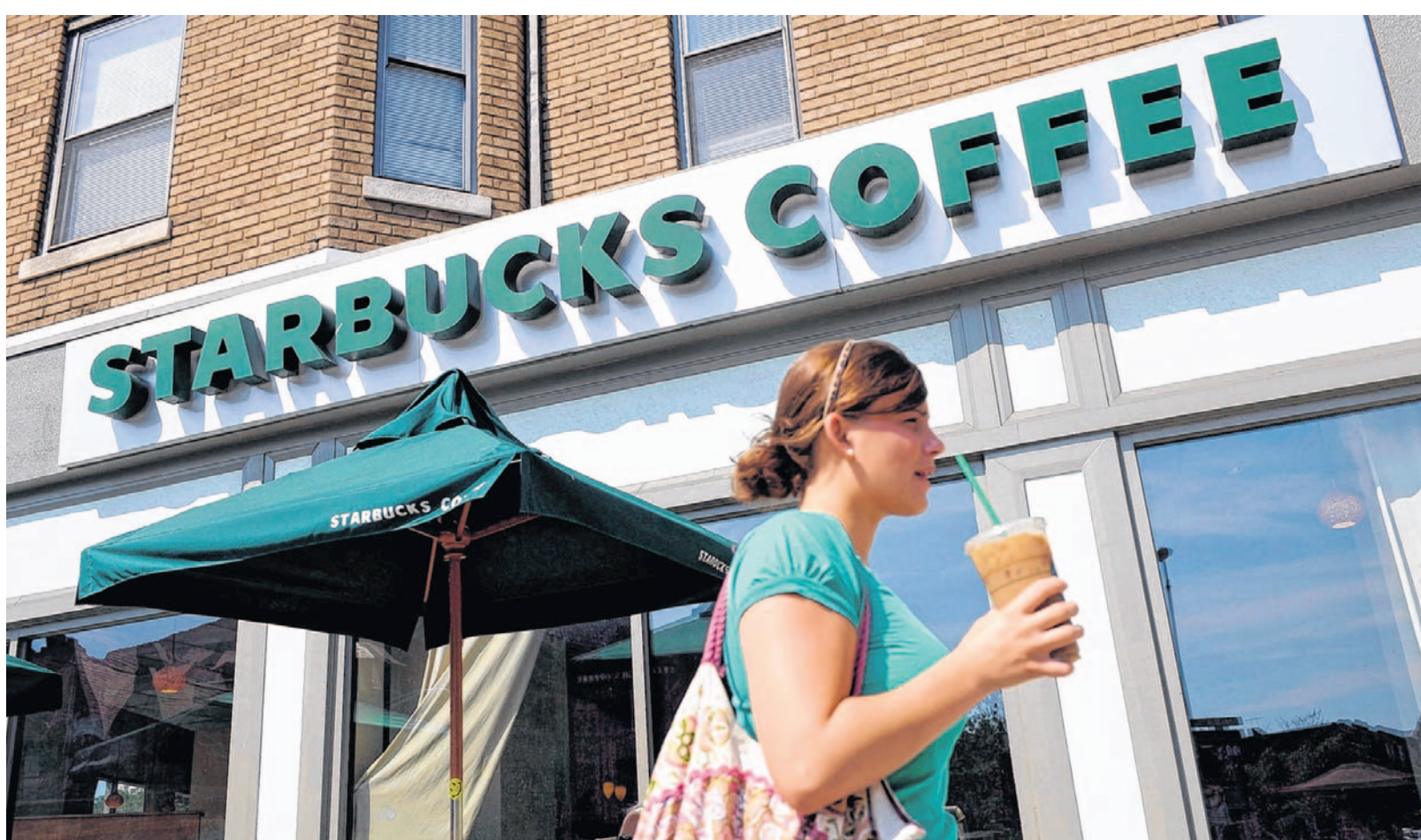
Starbucks gilt als teuer und rechtfertigt das selbst mit hoher Qualität. Den Kunden scheint es zu schmecken: Die Zahl der Geschäfte soll weiter wachsen.

Handel: Die US-Kette Starbucks will in Deutschland expandieren – und testet neue Verkaufskonzepte